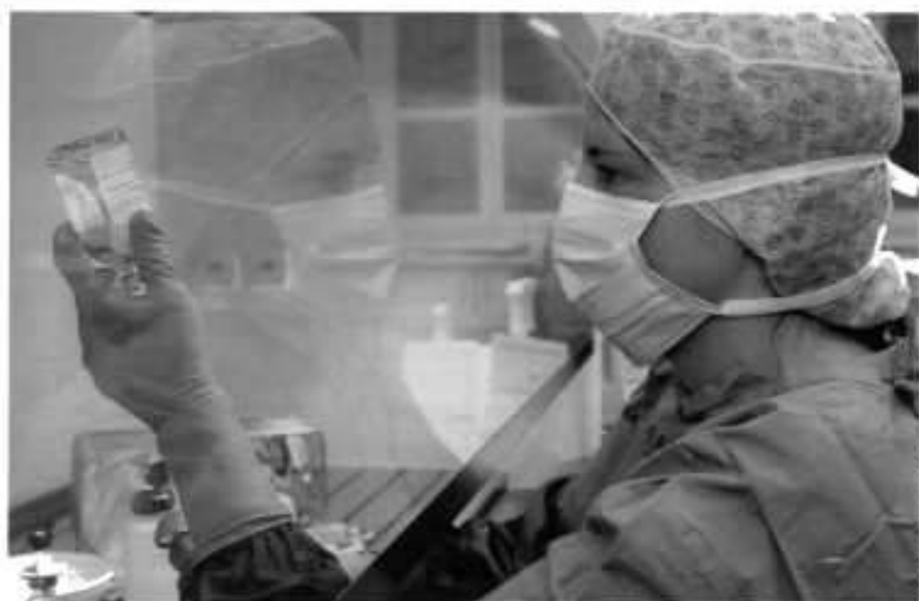
Forschung mit Zytostatika: „Es gab und gibt keine Erfolge“

Seit Jahrzehnten bringen Arzneimittelhersteller immer neue Zytostatika auf den Markt; in den siebziger Jahren waren 5, in den Neunzigern dagegen bereits rund 25 Mittel zugelassen. „Wenn da jedes Mal ein